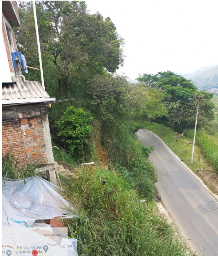
Fotografía de plásticos para lluvias instalados por la comunidad