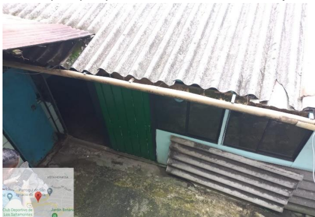
Fotografía de la vivienda deshabitada