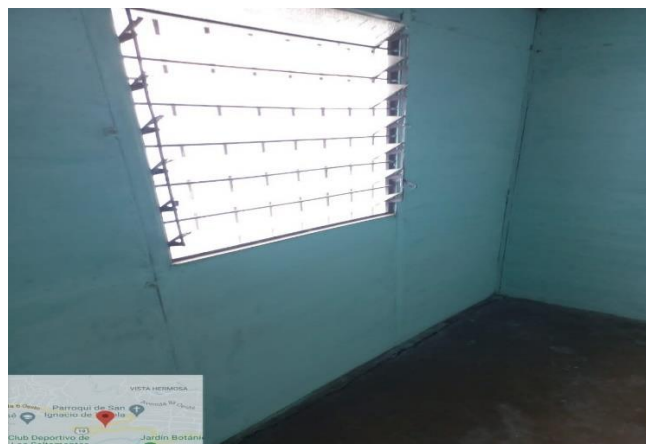
Fotografía de los muros de vivienda fisurados