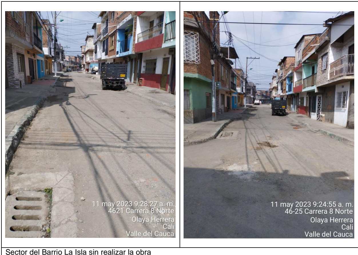
Sector del Barrio La Isla sin realizar la obra