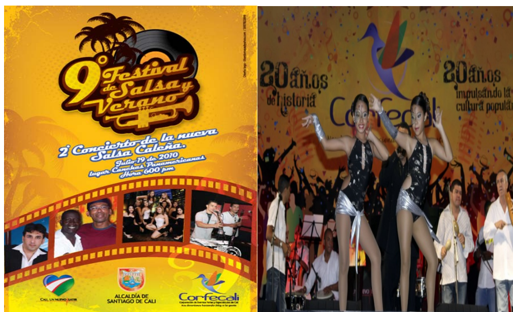
Afiche oficial del evento y presentación de artistas.

Este evento se llevó a cabo del 11 al 19 de septiembre en el Centro Cultural de Cali, Plaza de Toros Cañaveralejo, Teatro Municipal y el Teatro al Aire Libre los Cristales.