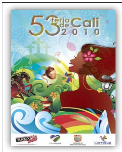
Afiche oficial de la 53ª feria.

Los siguientes cuadros muestran el impacto social de los eventos previamente analizados: