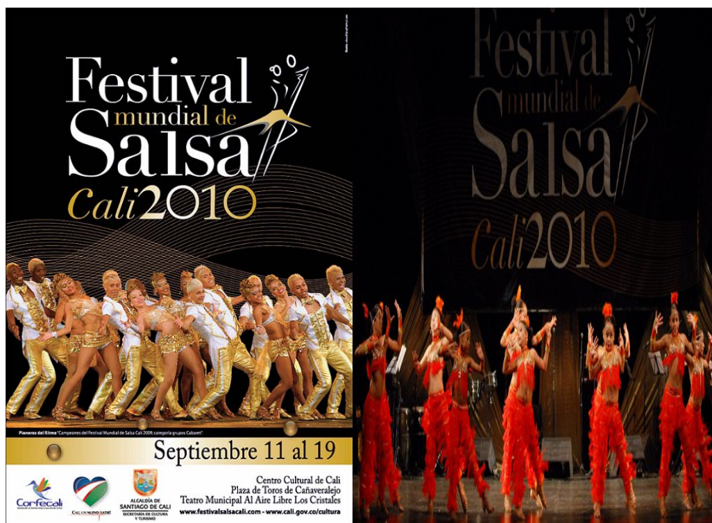
Afiche oficial del evento y presentación de artistas.

aproximadamente 129 escuelas de baile SALSA en la ciudad. El evento se realizó entre los días 11 y 19 de septiembre, en el Teatro al Aire Libre los Cristales.