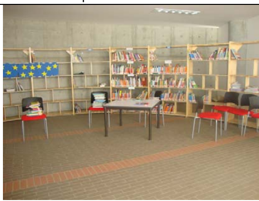
Dotación mobiliario en Biblioteca- visita fiscal septiembre 13 de 2011

Un logro evidenciado es la construcción y puesta en marcha de la Ciudadela Nuevo Latir que representa mejora en la calidad educativa, y sus instalaciones están compuestas por espacios amplios y cómodos para los estudiantes en un sector de la ciudad que presenta graves problemas sociales.