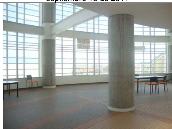
Torre biblioteca- visita fiscal septiembre 13 de 2011