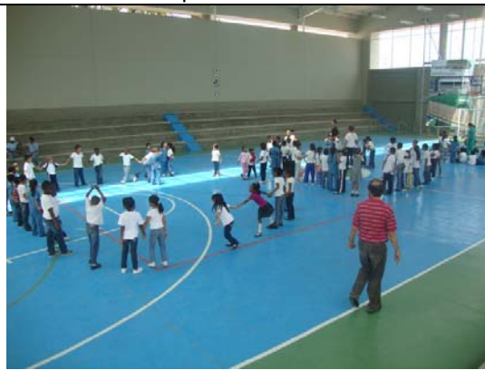
Vista interior coliseo- visita fiscal septiembre 13 de 2011