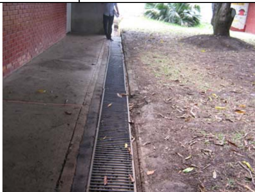
Visita fiscal I.E. Manuel María Mallarino- septiembre 12 de 2011