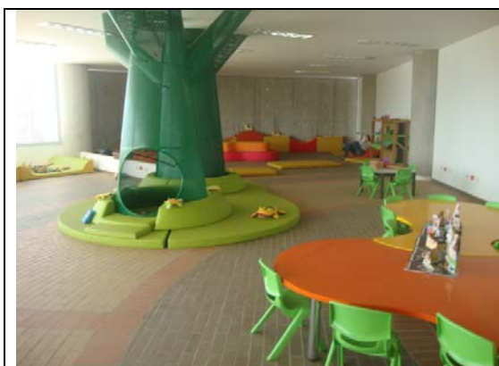
Dotación inmobiliario en Biblioteca- visita fiscal septiembre 13 de 2011