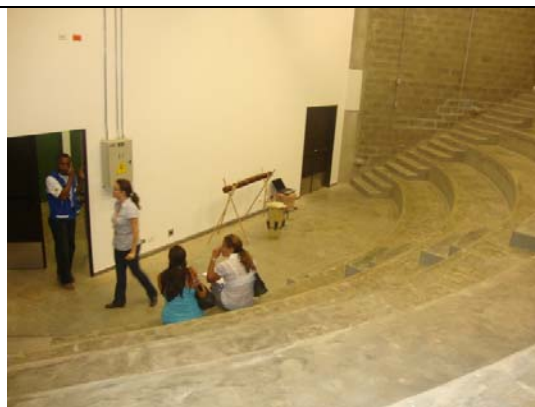
Auditorio interno en edificio biblioteca- visita fiscal septiembre 13 de 2011