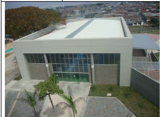
Vista panorámica del coliseo- visita fiscal septiembre 13 de 2011