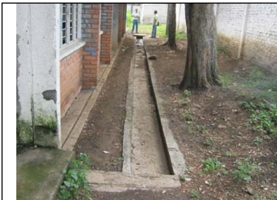
Visita fiscal I.E. Manuel María Mallarino- septiembre 12 de 2011

Mediante acta de recibo de fecha septiembre 15 de 2011 suscrita por el Consorcio Mova y la rectora de la Institución Educativa, el contratista cumplió con el compromiso pactado en la visita que efectuó la Contraloría y procedió a la unión de todas las rejillas que van sobre las canaletas construidas, tal como consta en el registro fotográfico.