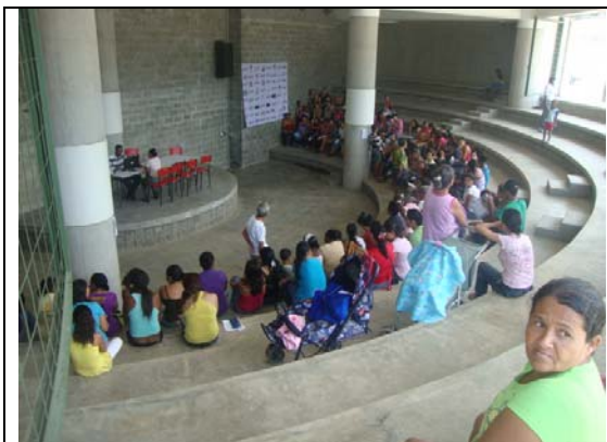
Auditorio externo en edificio biblioteca- visita fiscal septiembre 13 de 2011