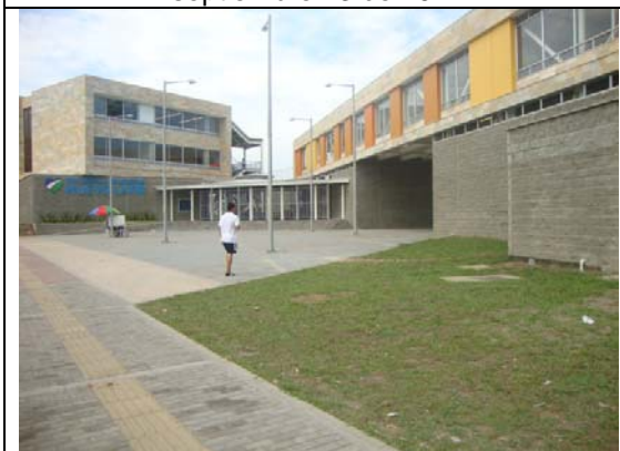
Fachada Occidental- visita fiscal septiembre 13 de 2011