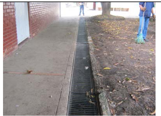
Visita fiscal I.E. Manuel María Mallarino- septiembre 12 de 2011