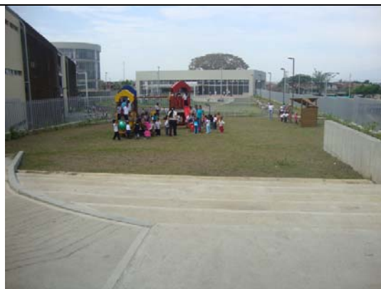
Zona de juegos de los niños del Cariño- visita fiscal septiembre 13 de 2011