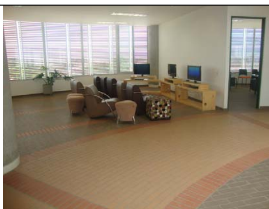
Dotación mobiliario en Biblioteca- visita fiscal septiembre 13 de 2011