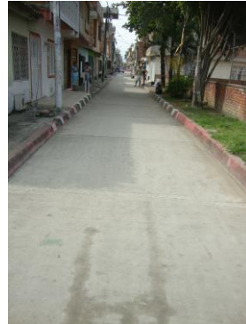
Tramo de vía objeto del contrato: Carrera 28 G entre calles 72Q y 72T