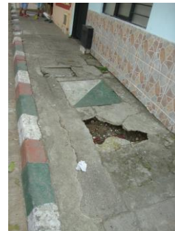
Anden frente a nomenclatura urbana No.72-R- pendiente de reparar