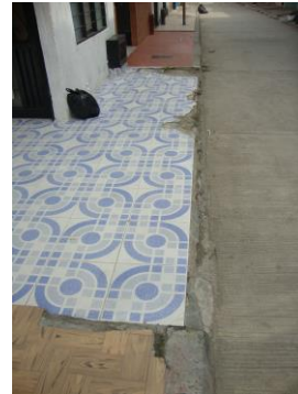
Anden frente a nomenclatura urbana No.72-R-50 pendiente de reparar