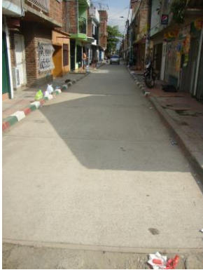
Tramo de vía objeto del contrato: Carrera 28 G entre calles 72T y 72Q