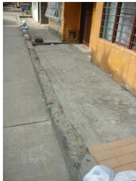
Anden frente a nomenclatura urbana No.72-R-50 pendiente de reparar