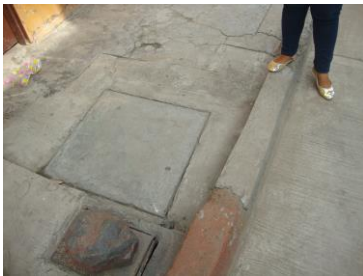
Anden frente a nomenclatura urbana No.72-R-34 pendiente de reparar