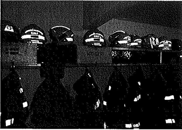
Dotación de equipos (trajes) especiales en la estación Central Norte