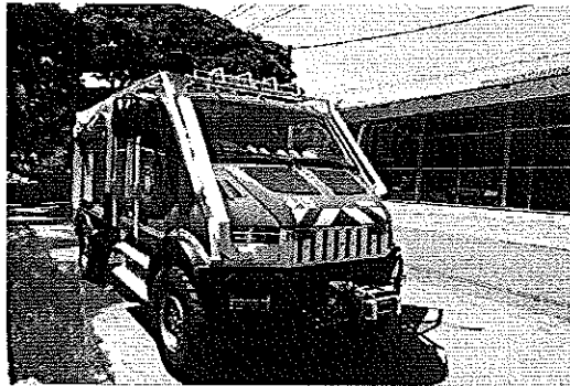
Máquina escalera adquirida ubicada en la estación Central Norte

El equipo auditor pudo evidenciar a través de visitas a las diferentes estaciones de Bomberos, la adquisición de los elementos relacionados en cuadro No. 8, los cuales se observan en el siguiente archivo fotográfico: