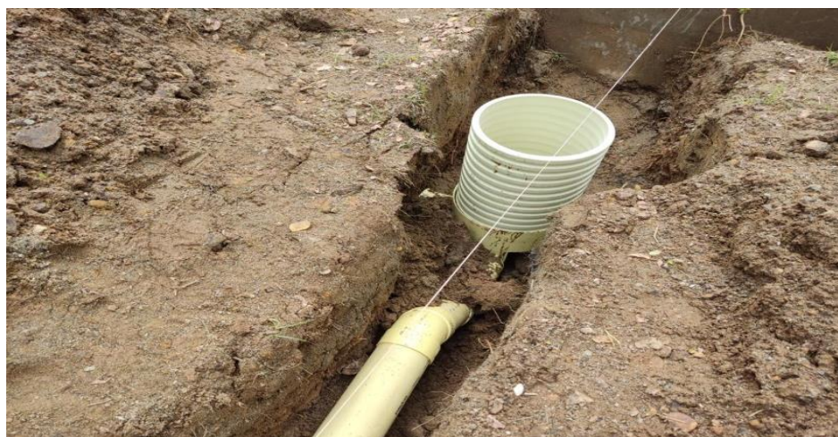
Adecuación de terreno – Instalación de redes hidrosanitarias