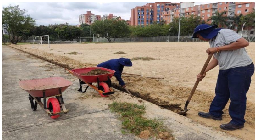
Adecuación de terreno – Instalación de redes hidrosanitarias