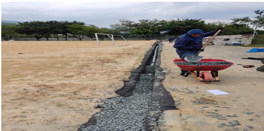
Adecuación de terreno – Instalación de redes hidrosanitarias