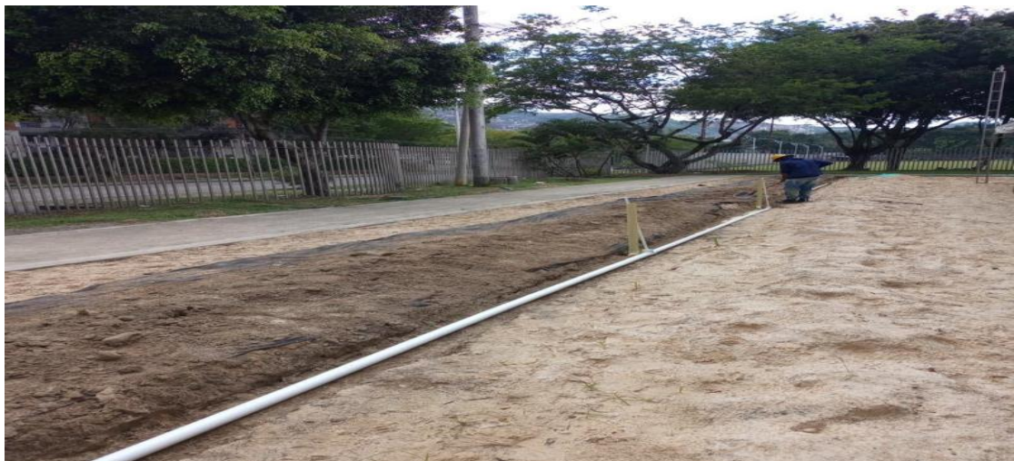
Adecuación de terreno – Instalación de redes hidrosanitarias