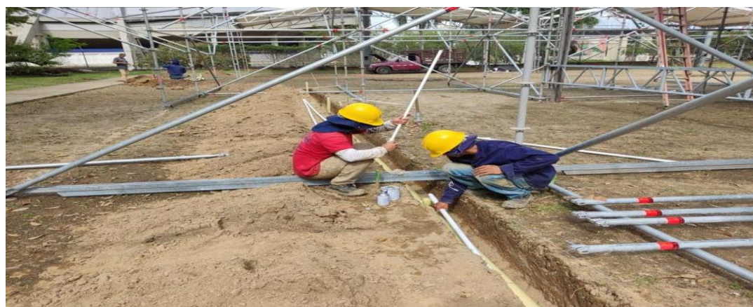
Adecuación de terreno – Instalación de redes hidrosanitarias e instalación de stands