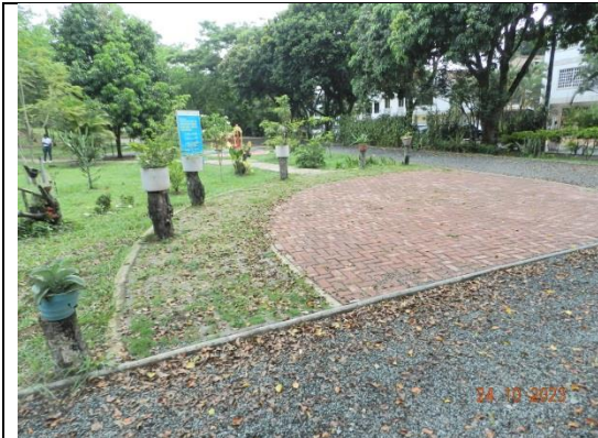
COMUNA 17 CANEY. Construcción de bordillos en concreto, instalación de adoquines, instalación de gramoquín de concreto con prado, siembra de maní forrajero y siembra de plantas ornamentales