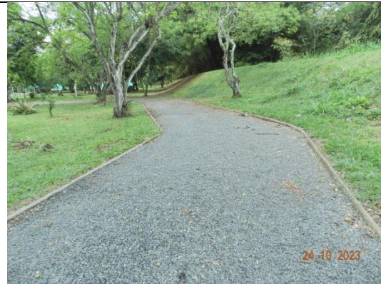
COMUNA 17 CANEY. Pista de trote, relleno y conformación con grava triturada compactada.