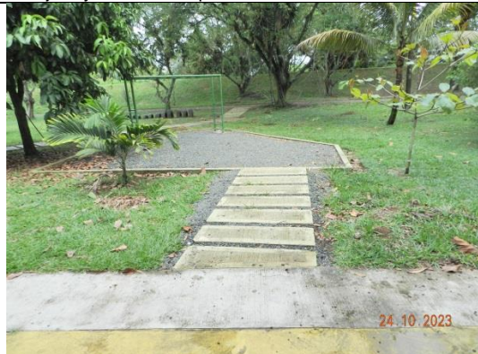
COMUNA 17 CANEY. Construcción bordillos en concreto, andenes en concreto, instalación de loseta prefabricadas, siembra de maní forrajero y siembra de plantas ornamentales.