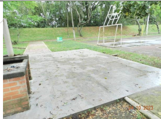
COMUNA 17 CANEY. Construcción de andenes en concreto, enchape de piso de cerámica, instalación de señales informativas del parque.